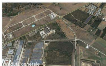
Veduta generale C