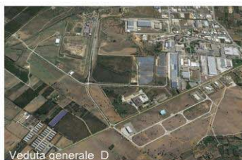
Veduta generale D