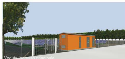
Veduta ingresso principale