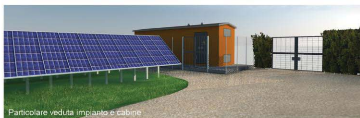
Particolare veduta impianto e cabine