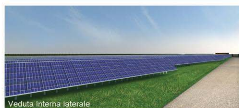
Veduta Interna laterale