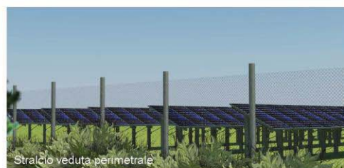
Stralcio veduta perimetrale