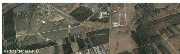
Veduta generale B